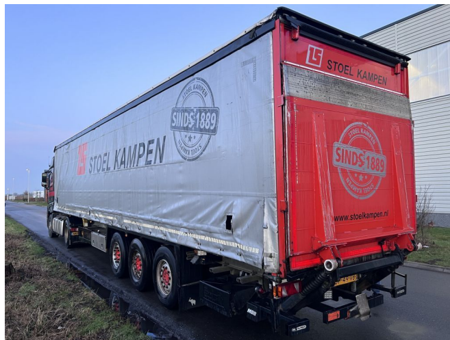
Schmitz Cargobull S01 + LAADKLEP + LIFT + STUURAS