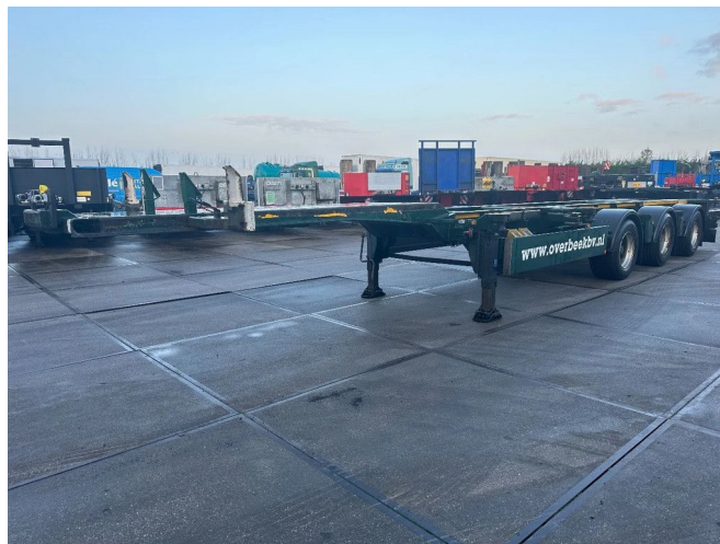
Renders 1 + 3e AXEL STEERING, LZV, 20,40,45 FT