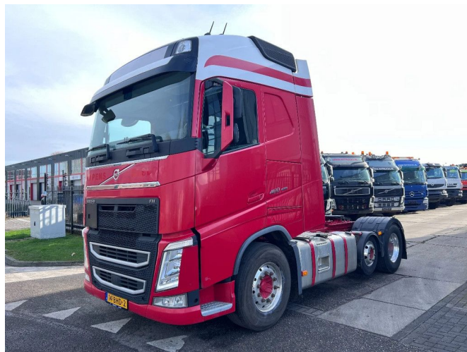
Volvo FH 460 6X2 EURO 6 ADR i-Shift i-ParkCool