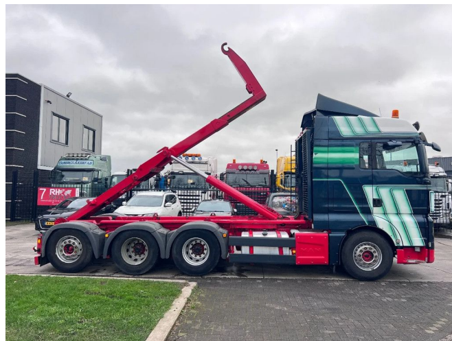
MAN TGX 35.480 8X4 EURO 6 HOOKLIFT