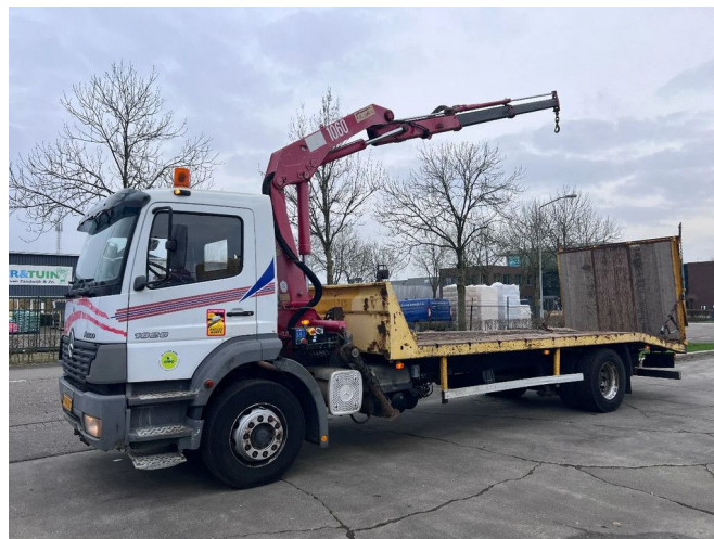
Mercedes-Benz Atego 1828 4X2 - HMF 1063 K2 - MANUAL ...