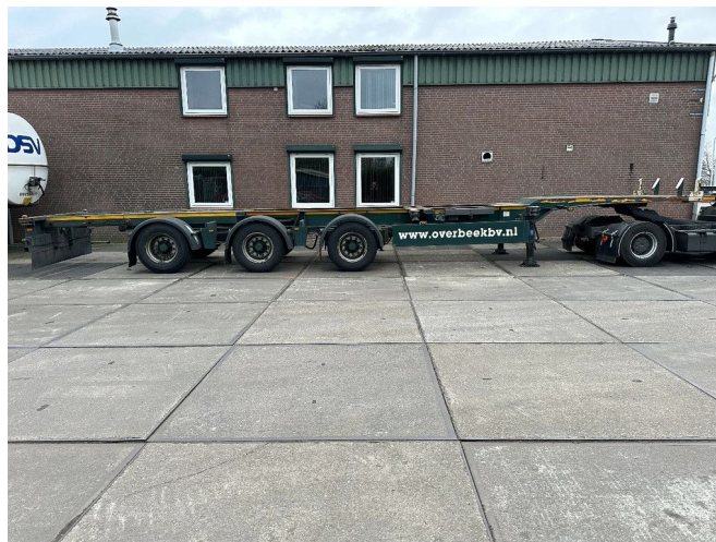
Renders 1 + 3e AXEL STEERING, LZV, 20,40,45 FT