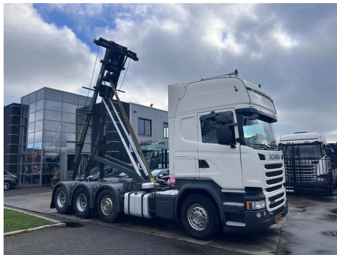
Scania R490 8X2 EURO 6 RETARDER + CABLE SYSTEM