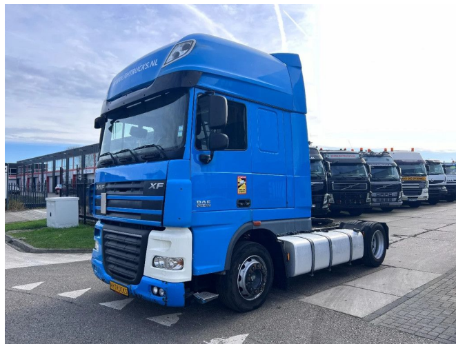
DAF XF 105.460 SSC 4X2 EURO 5 MEGA + RETARDER