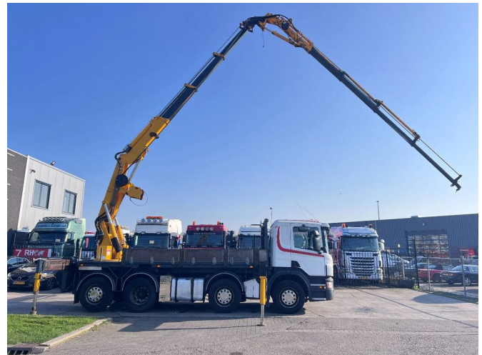
Scania P380 8X2-6 EURO 4 + EFFER 39 N3S Crane + FLYJI...