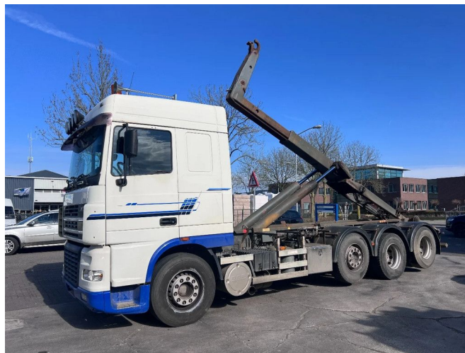
DAF XF 95.480 8X2 EURO 3 + VDL HOOKLIFT + MANUAL ...