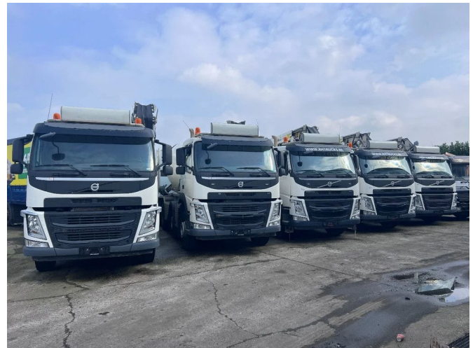
Volvo FM 410 5 UNITS - 8X4 MIXER 9m3 + LIEBHERR CON...