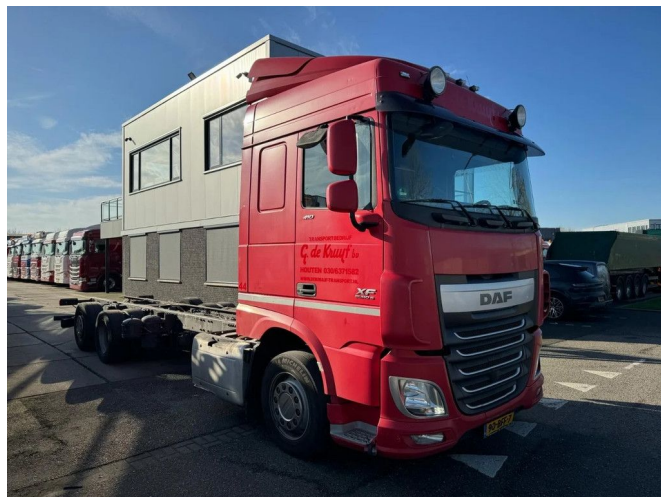
DAF XF 410 6X2 EURO 6 CHASSIS