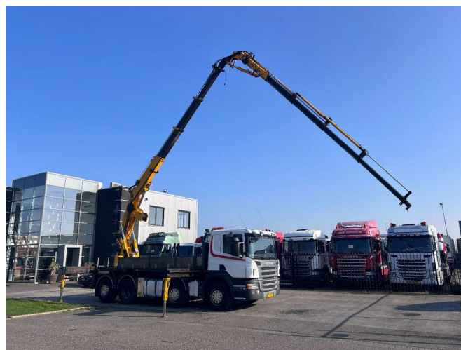
Scania P380 8X2-6 EURO 4 + EFFER 39 N3S Crane + FLYJI... Referentienummer: SC182154