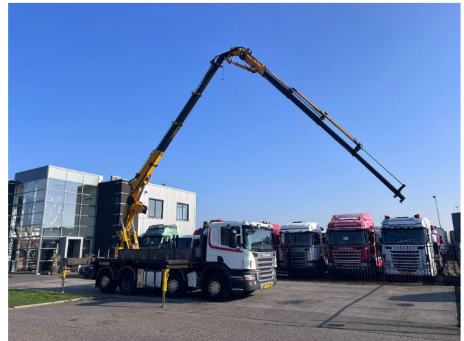
Scania P380 8X2-6 EURO 4 + EFFER 39 N3S Crane + FLYJI...