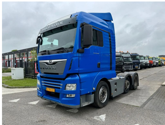
MAN TGX 26.460 6X2 EURO 6 + HYDRAULICS