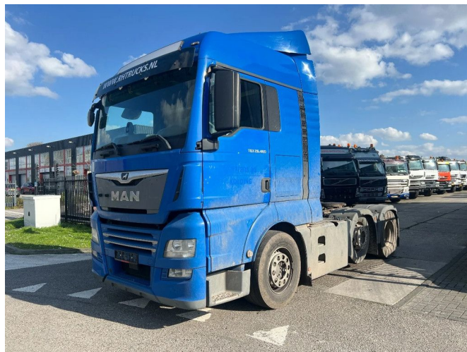
MAN TGX 26.460 6X2 EURO 6 + HYDRAULICS