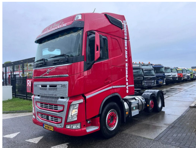
Volvo FH 500 6X2 EURO 6 DIESEL + LNG GAS