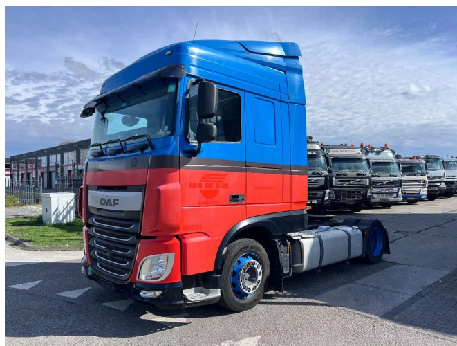
DAF XF 440 4X2 EURO 6 MEGA