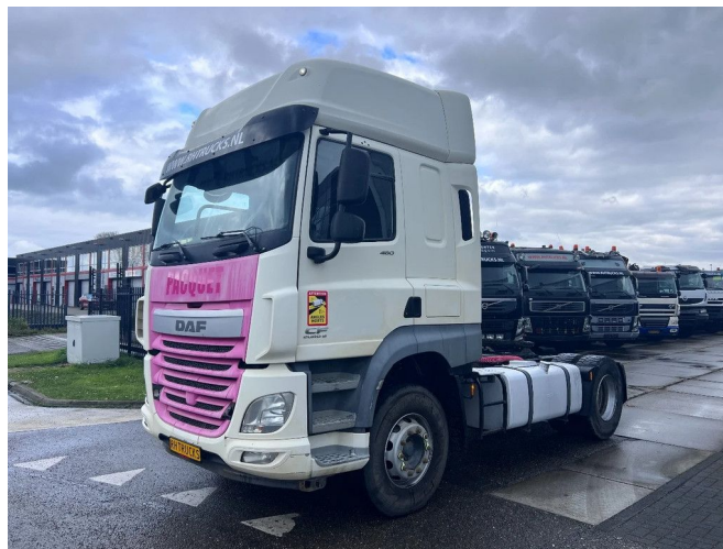
DAF CF 460 4X2 EURO 6 RETARDER + TIPPER HYDRAULIC