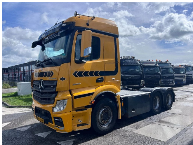
Mercedes-Benz Actros 2653 6X4 EURO 6 - BIG AXLES + HY...