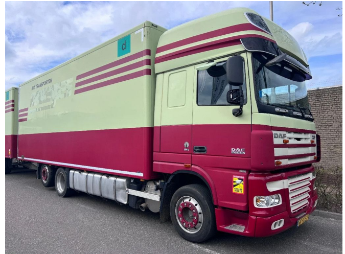
DAF XF 105.410 SSC 6X2 EURO 5 + TRS COOLING