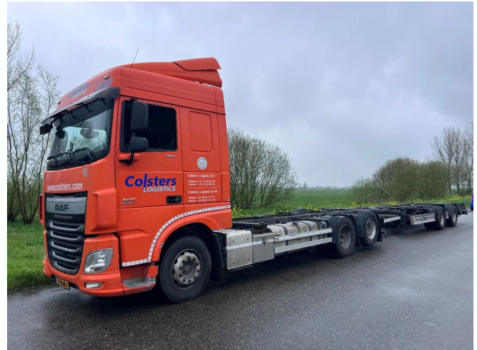
DAF XF 460 6X2 EURO 6 BDF + 2015 FLIEGL 2 AXLE