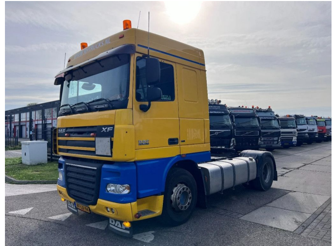
DAF XF 105.460 SC 4X2 EURO 5 MANUAL