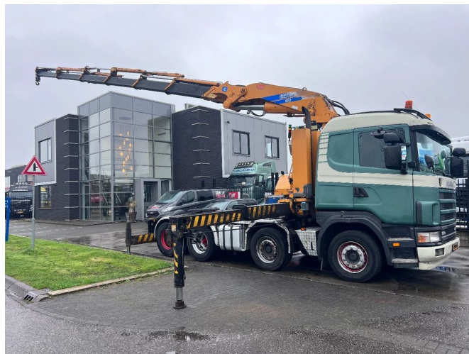
Scania R124-420 8X4 EURO 3 + EFFER 950/6S + 1 + REMOTE