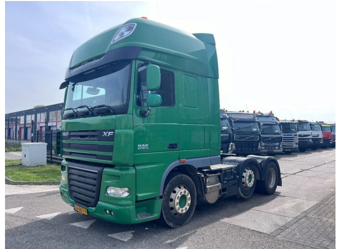
DAF XF 105.460 SSC 6X2 EURO 5