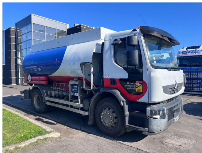
Renault Premium 270 ADR 4X2 EURO 5 EEV TANKWAGEN...