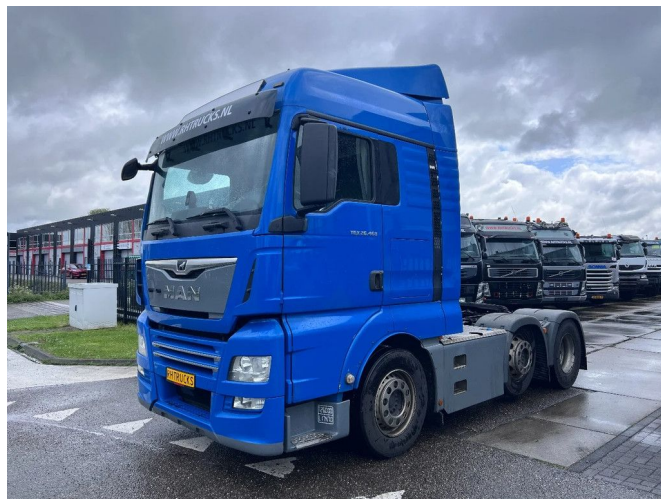
MAN TGX 26.460 XLX 6X2-2 EURO 6 LIFT AXLE