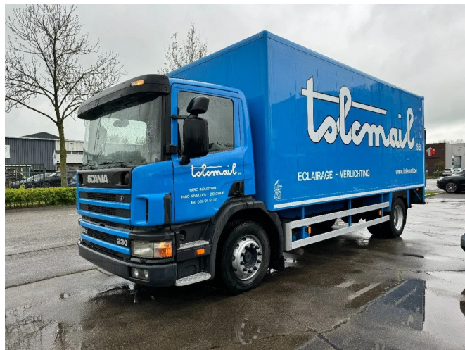
Scania P94-230 4X2 MANUAL GEAR - FULL STEEL SUSP. - ...