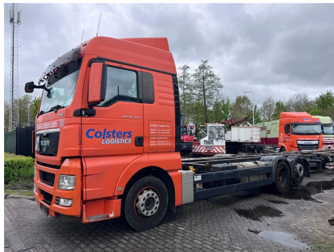
MAN TGX 26.440 XLX 6X2 EURO 5 - BDF CHASSIS + RET...