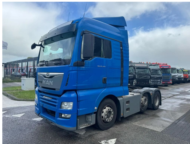
MAN TGX 26.460 XLX 6X2-2 EURO 6 LIFT AXLE