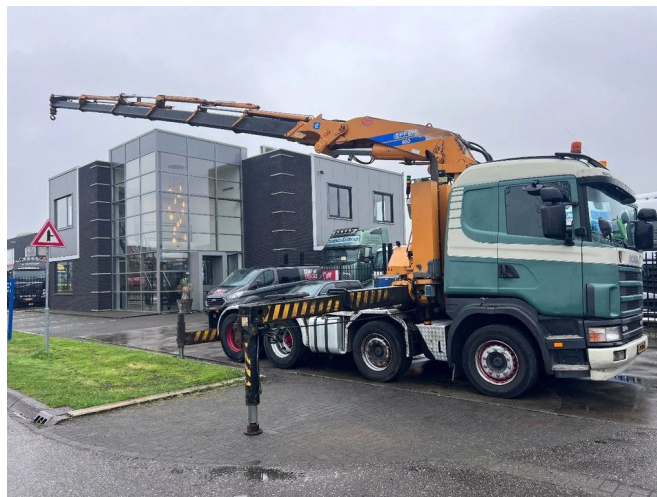
Scania R124-420 8X4 EURO 3 + EFFER 950/6S + 1 + REMOTE