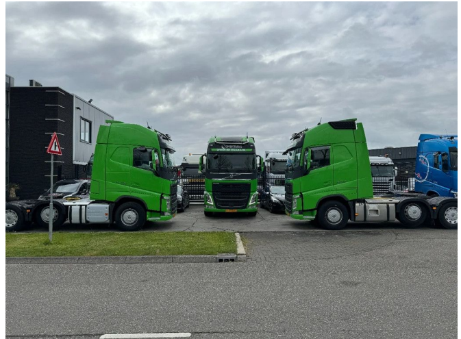
Volvo FH 460 6X2 EURO 6 + STEERING AXLE + HYDRAULICS