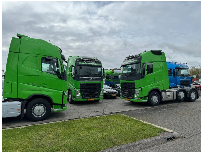
Volvo FH 460 6X2 EURO 6 + STEERING AXLE + HYDRAULICS