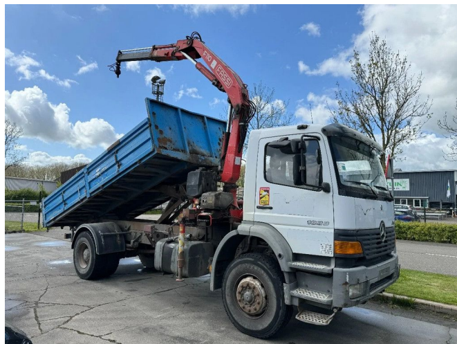
Mercedes-Benz Atego 1823 4X2 + FASSI F110A.21 + TIPPER...