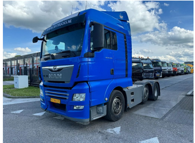
MAN TGX 26.460 XLX 6X2-2 EURO 6 LIFT AXLE