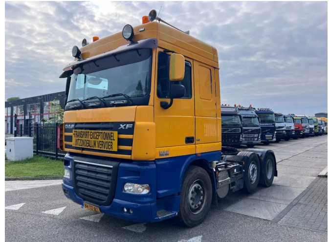
DAF XF 105.460 6X2 EURO 5 STEERING