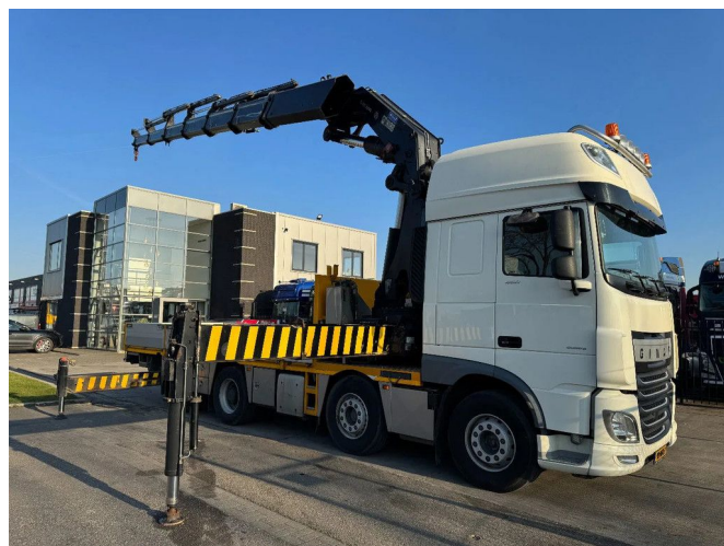
DAF XF 460 8X2 - EURO 6 + HIAB 855 EP-6 + REMOTE + S...