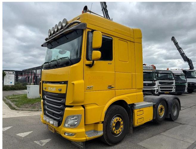
DAF XF 510 6X2 - EURO 6 + LIFT/STEERING AXLE + TÜV ...