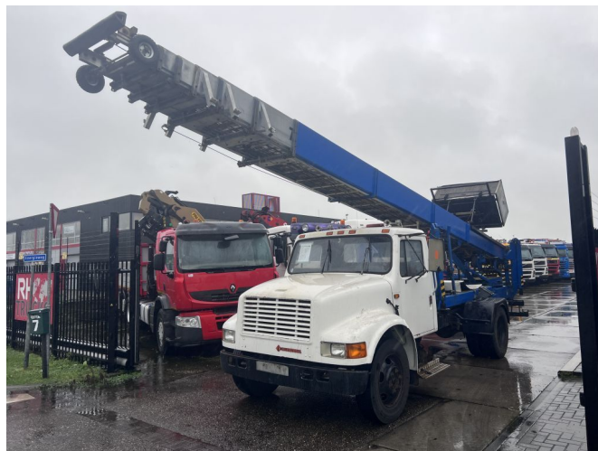
International 4600 4x2 210HP + TEUPEN hyLIFT