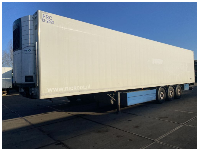
Schwarzmüller WITH MEATRAILS AND DOUBLE EVAPORA...