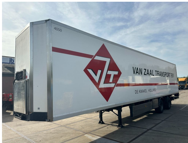
Burg LAST AXEL STEERING + LOAD LIFT