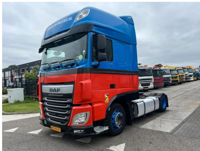
DAF XF 440 4X2 - EURO 6 - MEGA

• ABS • Aire acondicionado • Cabina de dormir • Cierre central de puertas • Cruise control • Doble Tanque de combustible • Freno de motor reforzado • Limitador de velocidad • Luces brillantes • Luces de niebla • Nevera • Parasol • Radio / reproductor de CD • Spoiler para el techo • Tanque de combustible de aluminio • Ventanas electrónicas