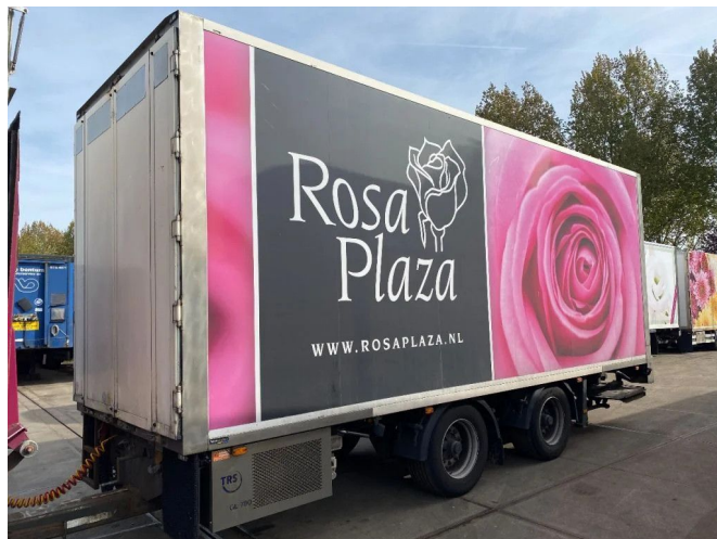
DRACO 2 AS - BPW + TRS FRIGO