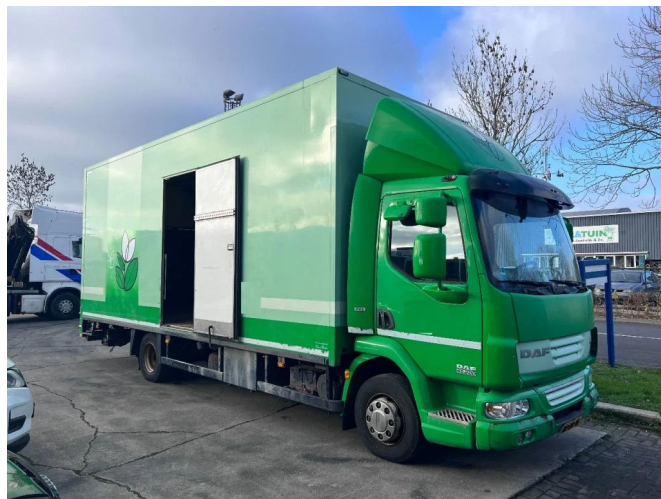
DAF LF 45 220 4X2 EURO 5 BOX 6.9mtr + LOAD-LIFT