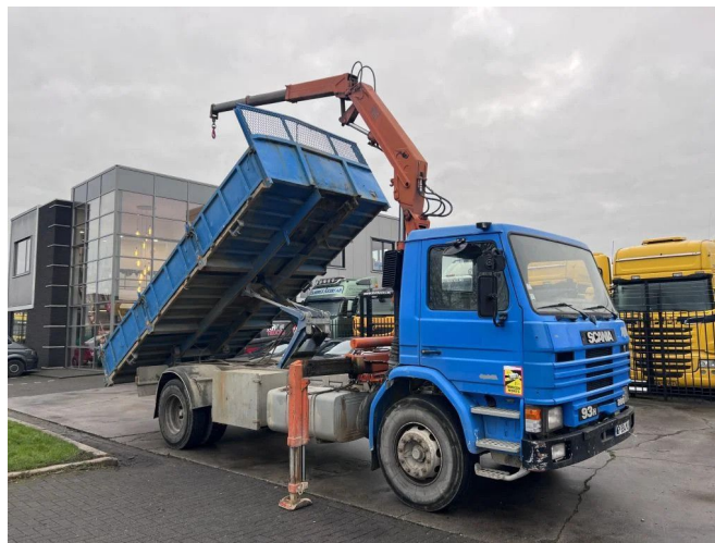
Scania P93 H 280HP 4X2 + ATLAS CRANE + KIPPER