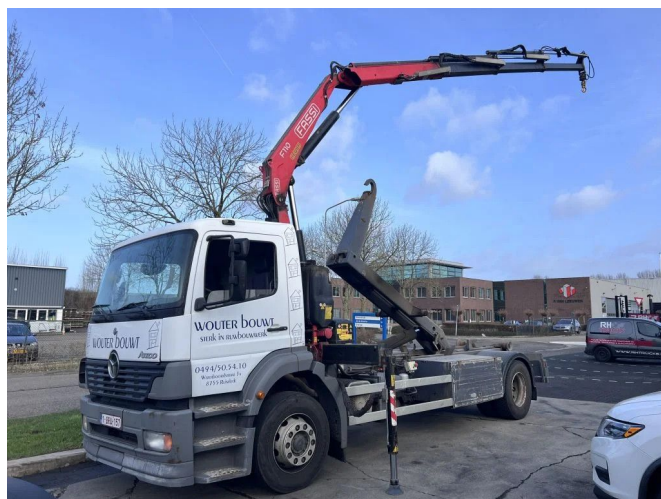
Mercedes-Benz Atego 1923 + 2011 FASSI F110 + 2011 ... 4x2