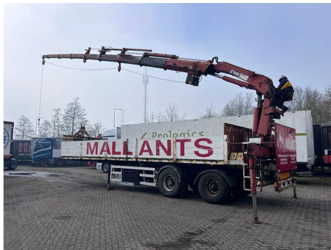
ATM 2 AS + HIAB 300-4 + WINCH