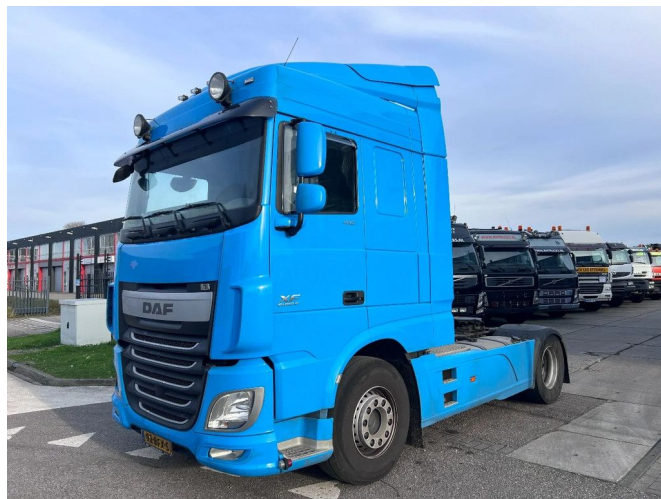
DAF XF 410 SC 4X2 EURO 6