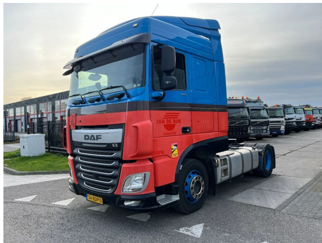
DAF XF 410 4X2 EURO 6 - STANDARD! (NOT MEGA)