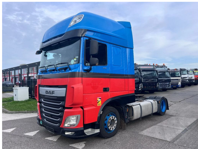
DAF XF 440 SSC 4X2 EURO 6 MEGA